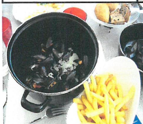
VIANDE D'ORIGINE FRANCAISE